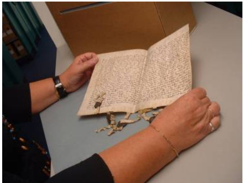
Eén van de nieuw verpakte charters