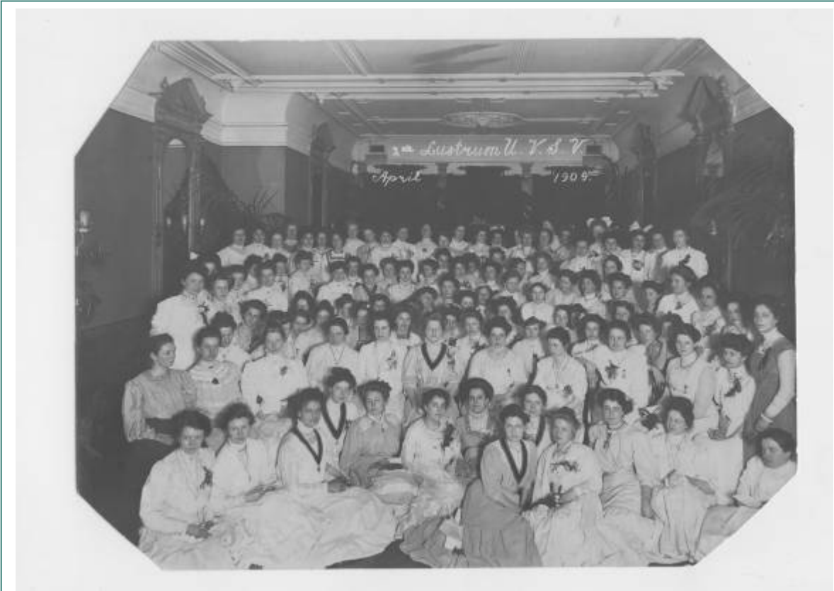
Tweede lustrum UVSV: groepsfoto en foto gemaakt tijdens het diner, 1909. inventarisnummer 937.